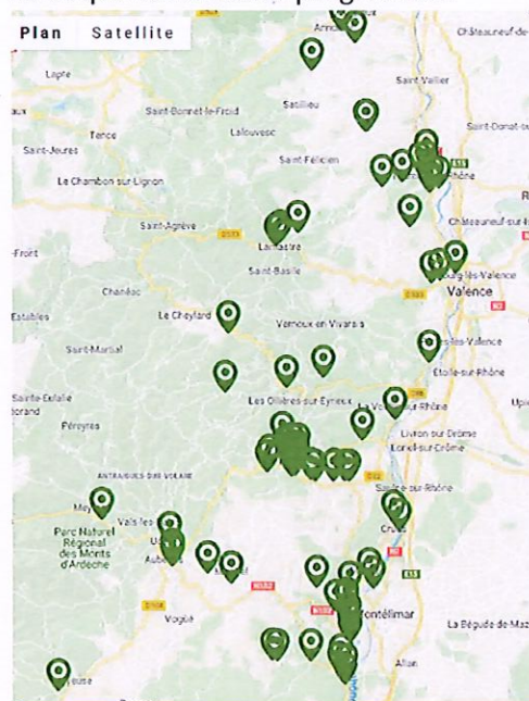
Carte : Nids confirmés de frelon asiatique sur le département de l'Ardèche en 2019

Les conditions climatiques de l'année semblent avoir été défavorables au prédateur. Malgré tout, le frelon asiatique continue sa progression.